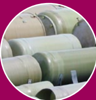
GVK, PP en PE tanks