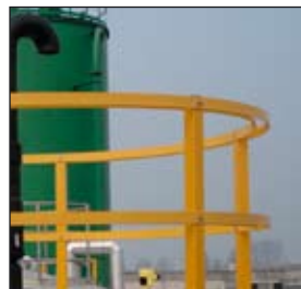
Polyester railingen en kooiladders