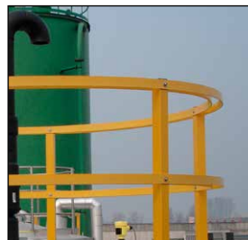
Polyester-Geländer und Steigleitern